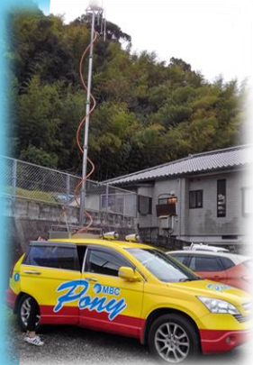
【写真】ポニー（ラジオカー）

「交通安全に関する取り組み」と「冬場の電気使用・安全」をリスナーへ広く呼びかけました。