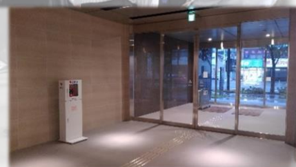
AEDは1階正面入り口に設置しています