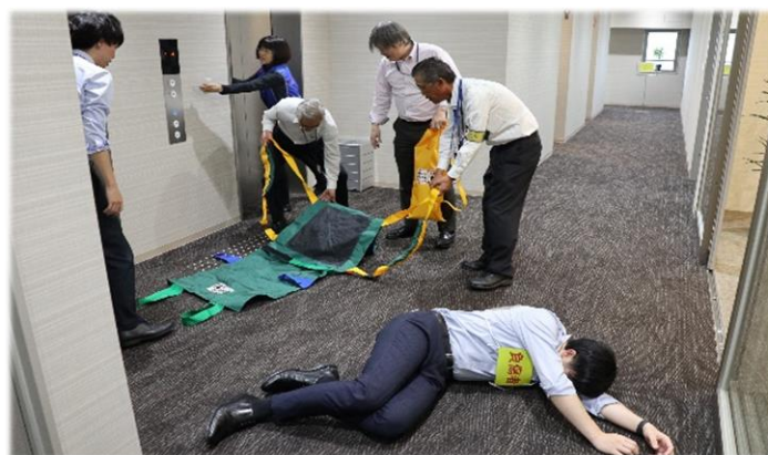
担架での負傷者救護

万一の際には慌てずに初期消火や避難、負傷者救護が出来るよう、避難訓練を踏まえた行動をお願いします。