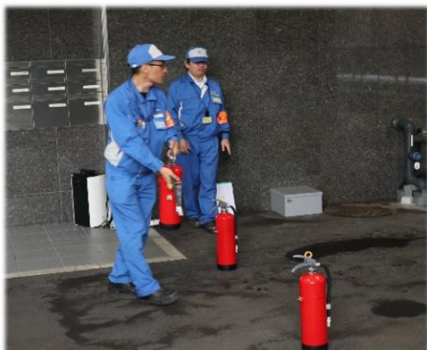
福岡支部技術部による消火器の使用方法説明